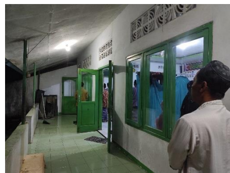
(Gambar 3. Prosesi Ritual Tolak Bala)