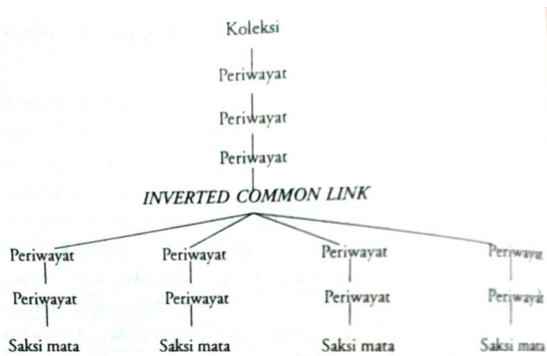
Diagram 4 60

Juynboll berkesimpulan bahwa model CL ditemukan dalam hadis hukum dan ICL ditemukan dalam hadis sejarah. Jika CL cenderung memalsukan hadis, ICL tidak. Artinya, otentisitas hadis hukum dipertanyakan, sementara hadis-hadis sejarah atau akhbār dapat diterima sebagai laporan yang dapat dipercaya. 61