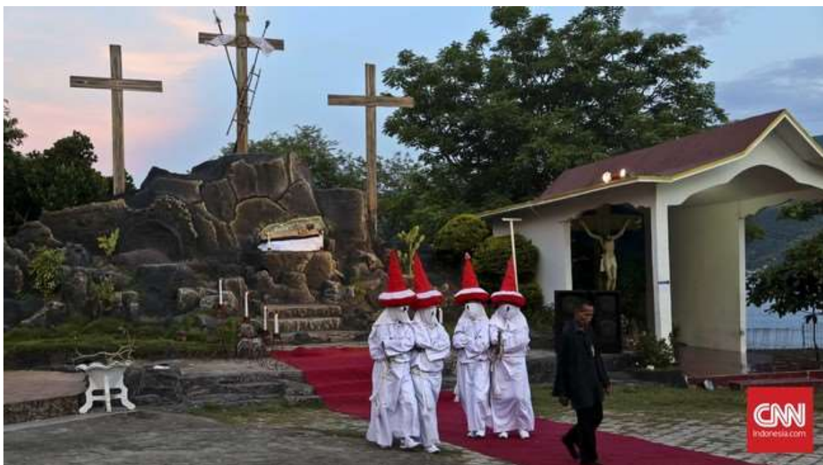
Gambar 3: Lakademu selesai melakukan prosesi di depan Kapel Tuan Ana , Larantuka, NTT, pada Jumat (25/3). Lakademu adalah orang yang bertugas memandu Keranda Patung Tuan Ana selama prosesi perarakan pada Malam Jumat Agung. (CNN Indonesia/Adhi Wicaksono) 28 .

Prosesi malam ini menyinggahi delapan armida. Di tiap armida acara meliputi Pentakhtaan Salib, Pembacaan Injil, Doa Tanggapan, dan menyanyikan kidung ‘ O Vos ’ 29 dan ‘ Signor deo ’. Kidung ‘ Signor deo ’ dibawakan koor laki-laki dan perempuan. Sedangkan kidung ‘ O Vos ’ dibawakan penyanyi tunggal (solis) seorang perempuan yang sambil bernyanyi secara perlahan membuka gulungan gambar Yesus yang bermahkota duri. Penyanyi perempuan itu melambangkan Veronika 30 yang mengusap wajah Yesus