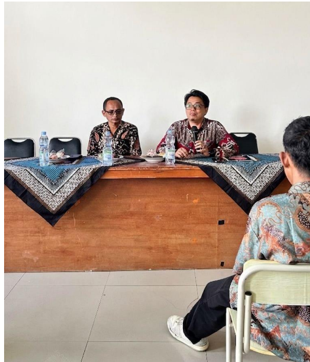
Gambar 4. Pemaparan materi penanggulangan NAPZA oleh tim pengabdian

Secara pedagogis, sesi materi diarahkan untuk membangun pemahaman secara bertingkat. Tahap awal menekankan definisi dan jenis NAPZA, dilanjutkan dengan pembacaan faktor risiko serta dampaknya, kemudian ditutup dengan latihan mengenali strategi pencegahan dan peluang peran peer educator di lingkungan peserta. Sesi materi juga menekankan pentingnya pengurangan stigma. Anak jalanan yang pernah berinteraksi dengan lingkungan berisiko tidak diposisikan sebagai sumber masalah, melainkan sebagai subjek yang memiliki kapasitas untuk belajar, melindungi diri, dan berkontribusi dalam perubahan lingkungan sosialnya.