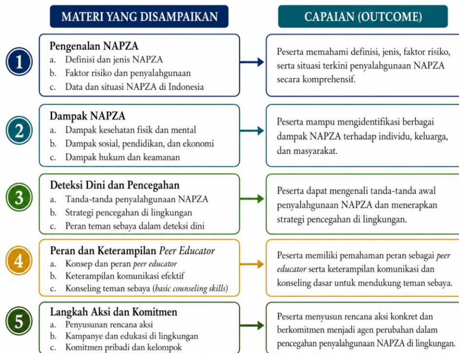
Gambar 3. Keterkaitan materi penyuluhan dan capaian program

NAPZA. Materi penyuluhan disusun secara bertahap, mulai dari pengenalan NAPZA, faktor risiko anak jalanan, dampak multidimensi penyalahgunaan, strategi pencegahan di lingkungan sehari-hari, hingga peran pendidik sebaya dan keterampilan komunikasi dasar. Pemahaman awal mengenai NAPZA perlu dijelaskan secara sederhana karena istilah tersebut mencakup narkoba, psikotropika, dan zat adiktif yang dapat memengaruhi kondisi fisik, psikis, serta fungsi sosial seseorang (RS Universitas Udayana, 2024). Susunan materi ini dimaksudkan agar peserta memperoleh pemahaman yang utuh, tidak terputus, dan mudah dihubungkan dengan situasi yang mereka hadapi. Keterkaitan antara materi yang disampaikan dan capaian pembelajaran peserta diringkas pada Gambar 3.