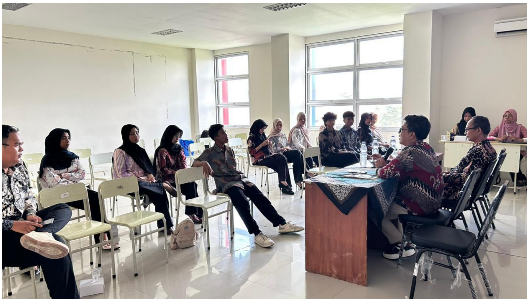
Gambar 2. Penyuluhan dan diskusi partisipatif bersama peserta kegiatan

Penyuluhan dilaksanakan melalui diskusi partisipatif yang melibatkan tim pengabdian, mahasiswa, mitra, dan peserta sasaran. Substansi materi mencakup pengenalan NAPZA, faktor risiko, dampak kesehatan dan sosial, strategi pencegahan, serta penguatan peran peer educator sebagai agen edukasi sebaya. Metode dialogis dipilih agar peserta tidak hanya menerima informasi, tetapi juga menafsirkan materi berdasarkan pengalaman hidup mereka. Dengan cara ini, penyuluhan menjadi ruang belajar bersama yang lebih setara, reflektif, dan kontekstual bagi anak jalanan serta remaja rentan.