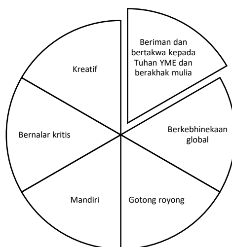
Gambar 1. Manajemen Penguatan Profil Pelajar Pancasila Dalam Kurikulum Merdeka Belajar

Selain hal diatas, bimbingan dan konseling mempunyai peran sebagai pendukung penguatan profil pelajar pancasila. Penguatan tersebut terdiri dari enam elemen, yakni (1) beriman dan bertakwa kepada Tuhan YME dan berakhlak mulia, (2) berkebhinekaan global, (3) gotong royong, (4) mandiri, (5) bernalar kritis, dan (6) kreatif.