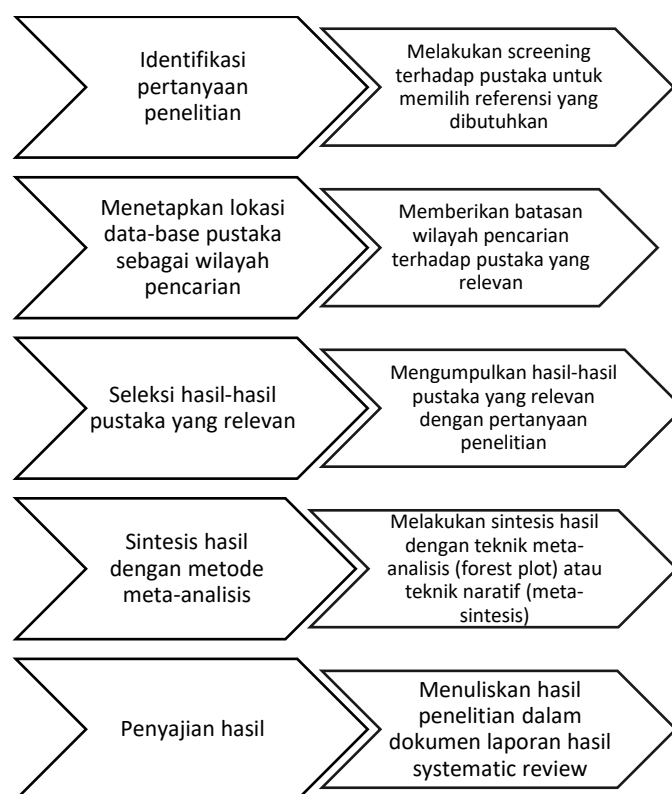
Gambar 3. Alur Analisa Pustaka

Pada tahap pertama, peneliti memilah sumber yang berkaitan dengan tiga topik besar. Topik tersebut diambil dari berbagai referensi. Salah satu referensi yang paling akurat adalah modul kurikulum merdeka belajar yang dikeluarkan oleh kementerian pendidikan sebagai acuan bagi sekolah untuk menyusun kurikulum merdeka belajar. Referensi tersebut diambil sebagai salah satu sumber pengumpulan data terkait tiga topik besar. Buku panduan penyusunan proyek penguatan profil pelajar pancasila (Kemdikbudristek, 2020) digunakan untuk mengetahui seperti apa pelaksanaan proyek penguatan karakter. Sumber lain yang dipakai adalah panduan pelaksanaan layanan bimbingan dan konseling yang dikeluarkan juga oleh kementerian pendidikan dan kebudayaan (Kemendikbud, 2016).