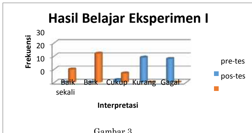
Gambar 3 Hasil Belajar Siswa Kelas Eksperimen I

Dari data nilai hasil pre-tes dan post-tes kelas eksperimen I, berikut ini adalah disajikan dalam bentuk diagram batang: